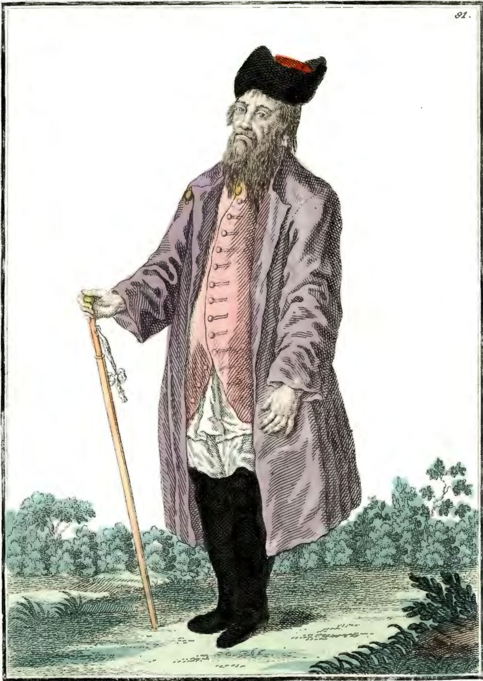
Калужской Купецъ. Ein Kaufman aus Kaluga. Marchand de Kaluga.