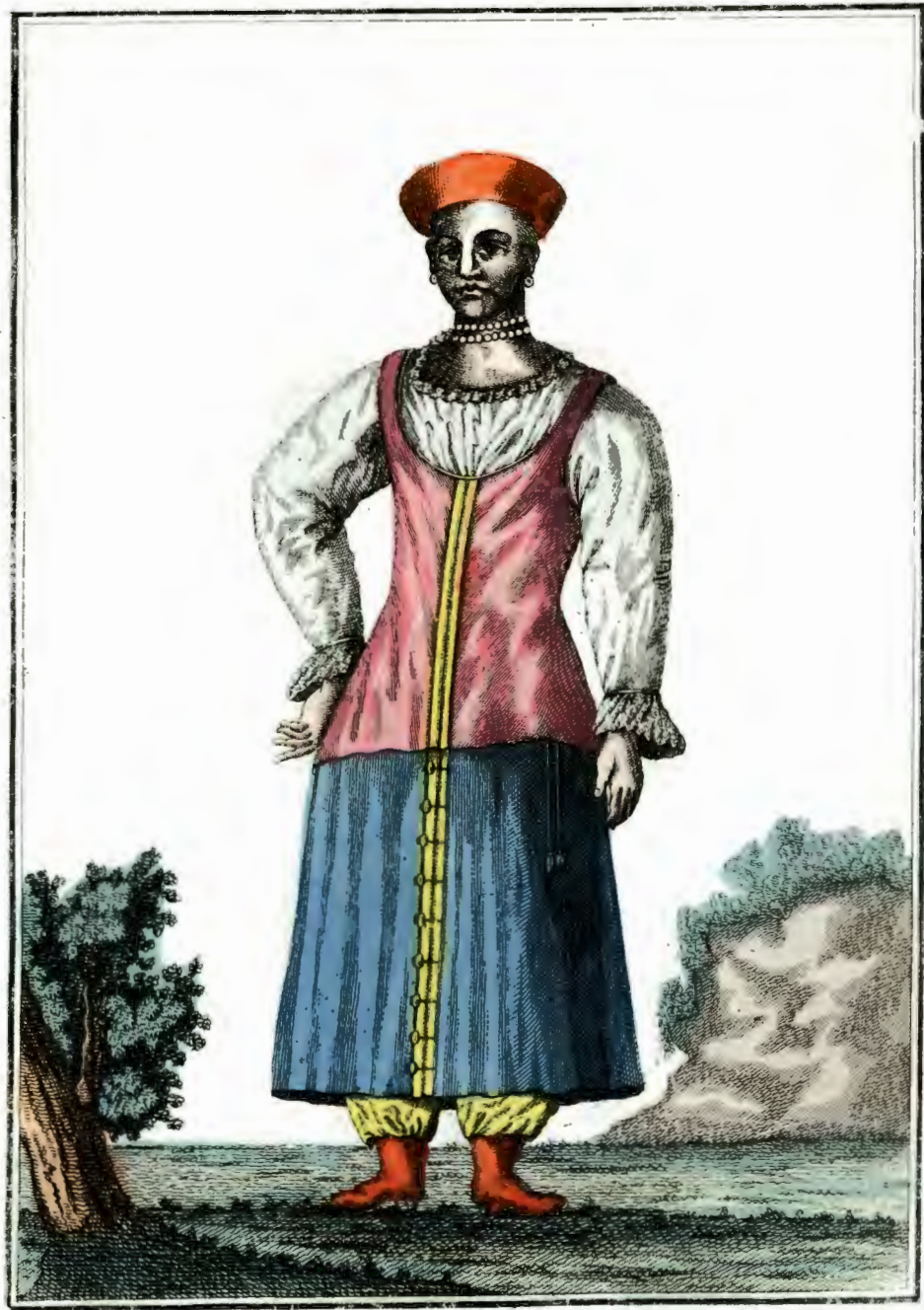
Донская Козарка. Eine Donische Cofacquin. Une Femme des Cosaques de Don.