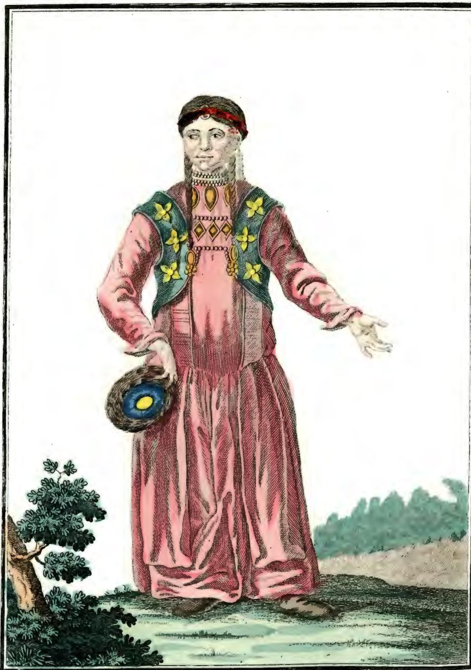
Брацкя баба въ удинскомъ Острогъ съ лица. Ein Bratzkisches Weib zu Udinskoi Ostrog vorwärts. Femme Bratsquienne à Udinskoi Ostrog par devant.