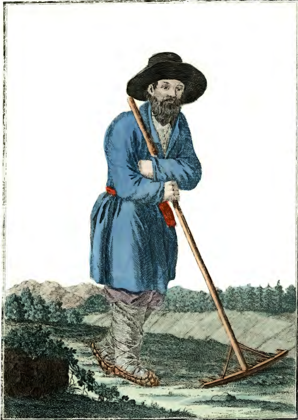
Россійскій Крестникъ. Ein Russischer Bauer. Un Puitsin Russe.