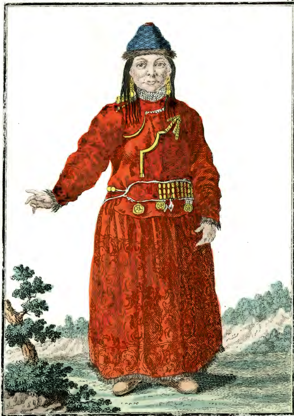
Брацкая Дѣвушка въ Удинскомъ Острогѣ спереди Eine Bratzkische Jungfer zu Udinskoi Ostrog vorwärts Fille Bratzke a Udinskoi Ostrog par devant.