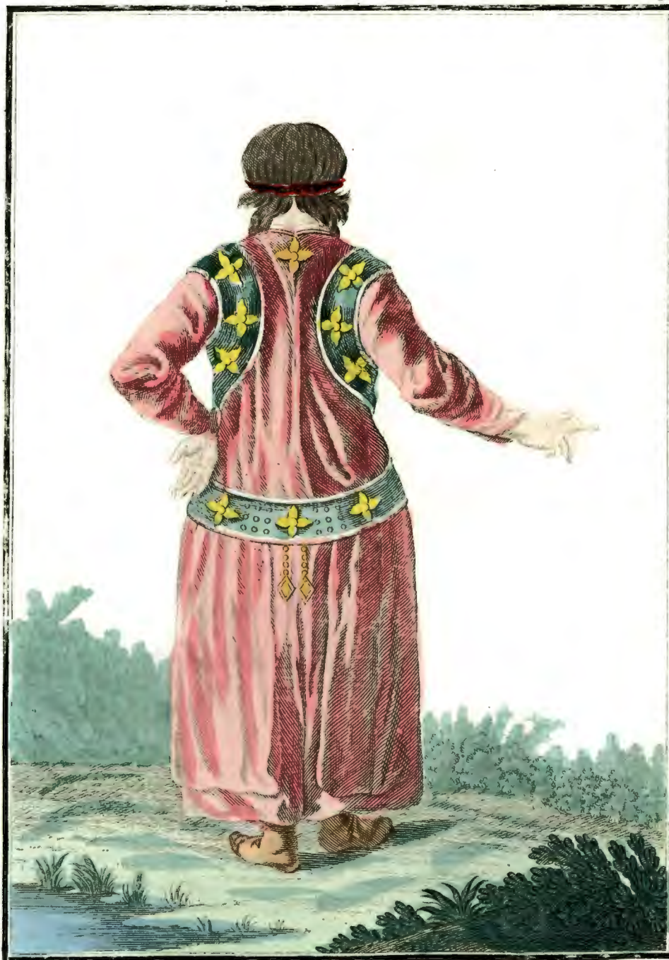
Брацкая баба въ Удинскомъ Острогѣ съ тыла Ein Bratzkisches Weib zu Uldinskoi Ostrog rückwärts Femme Bratzkiene à Uldinskoy Ostrog par derrière