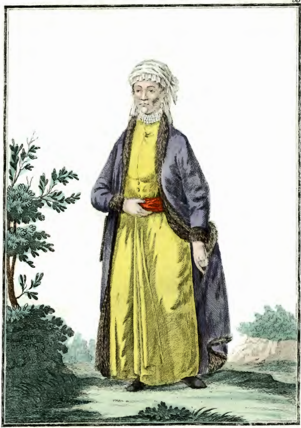
Армянка. Eine Armenianerin. Une Arménienne.