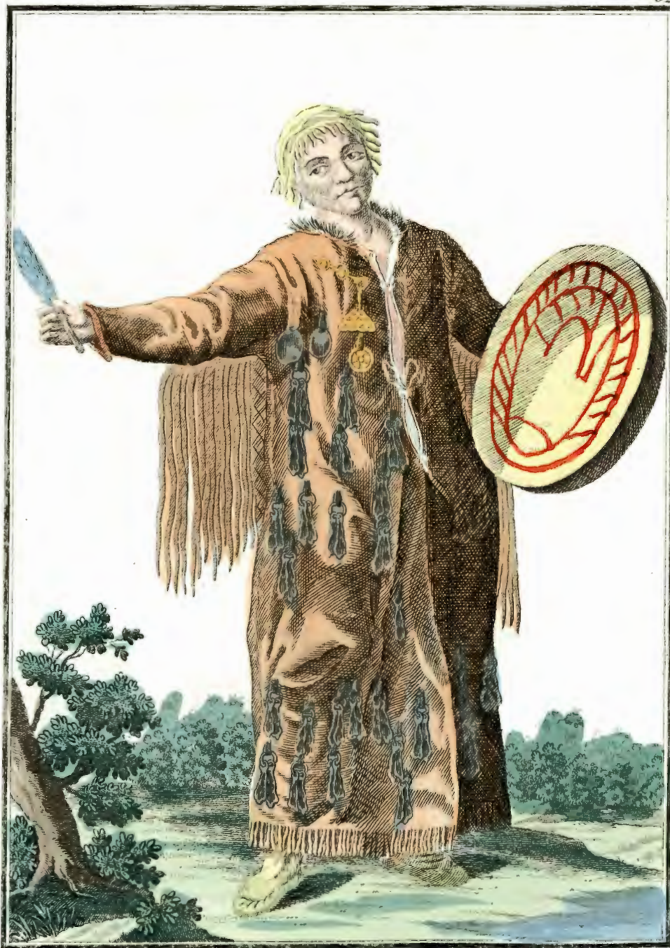
Брацкая Шапанка съ лица. Eine Bratzkische Schamanka vorwärts. Chamañe Bratsquieñe par devant.