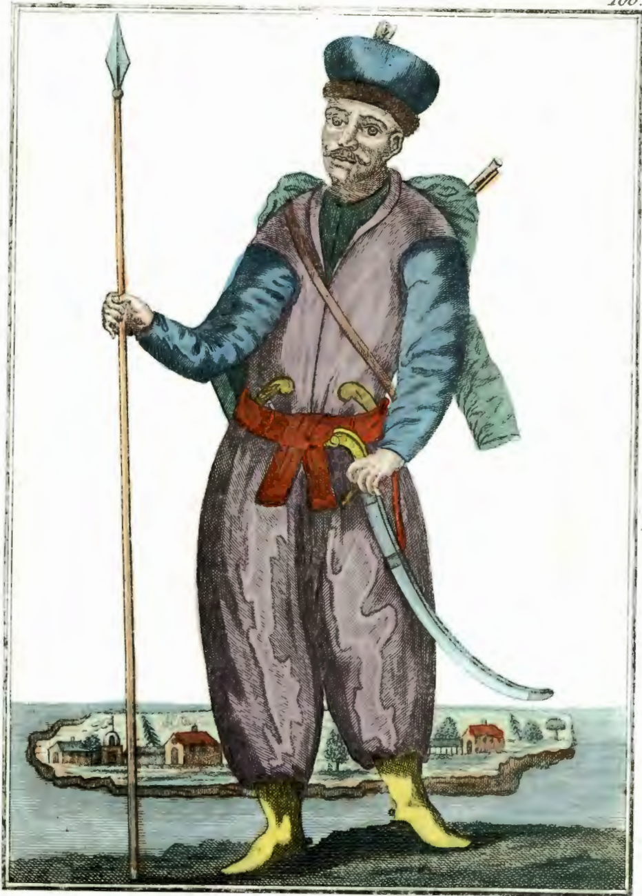
Черноморскій Козакъ. Ein Cosacy vom Schwarzen See Un Cosaque de la Mer Noire.