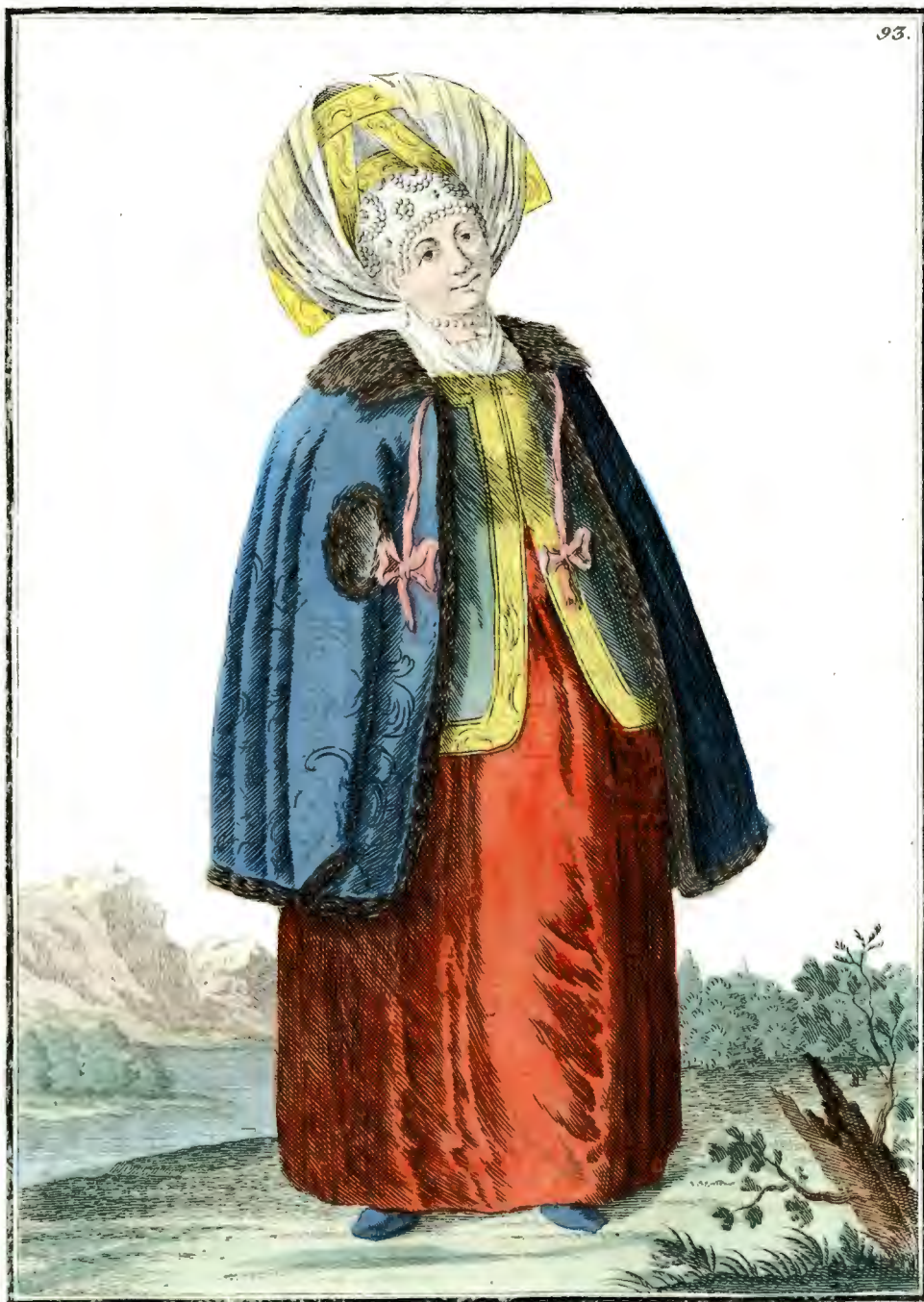
Калу́жская женщина въ зимней платьѣ. Eine Kaluzgische Frau im Winterkleide. Une Femme de Kalouga en habit d'hiver.