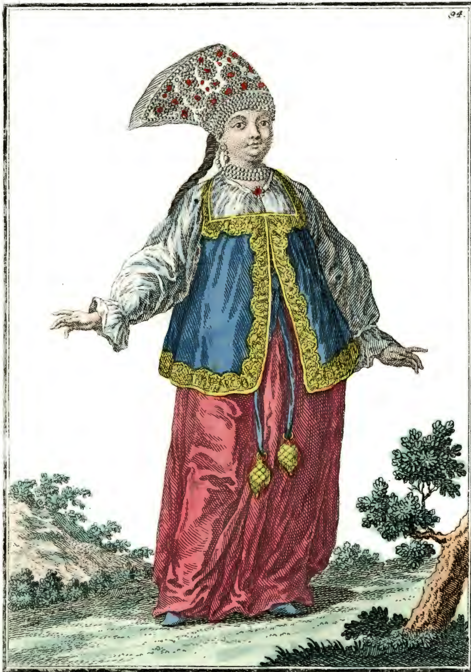
Калужская дѣвица спереди. Eine Jungfer aus Caluga vorwärts. Fille de Kaluga par devant.