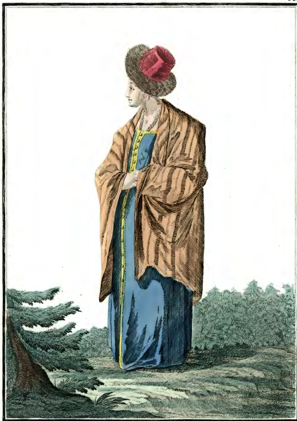
Валдайская баба. Ein Waldaijsches Weib. Femme de Waldaij.