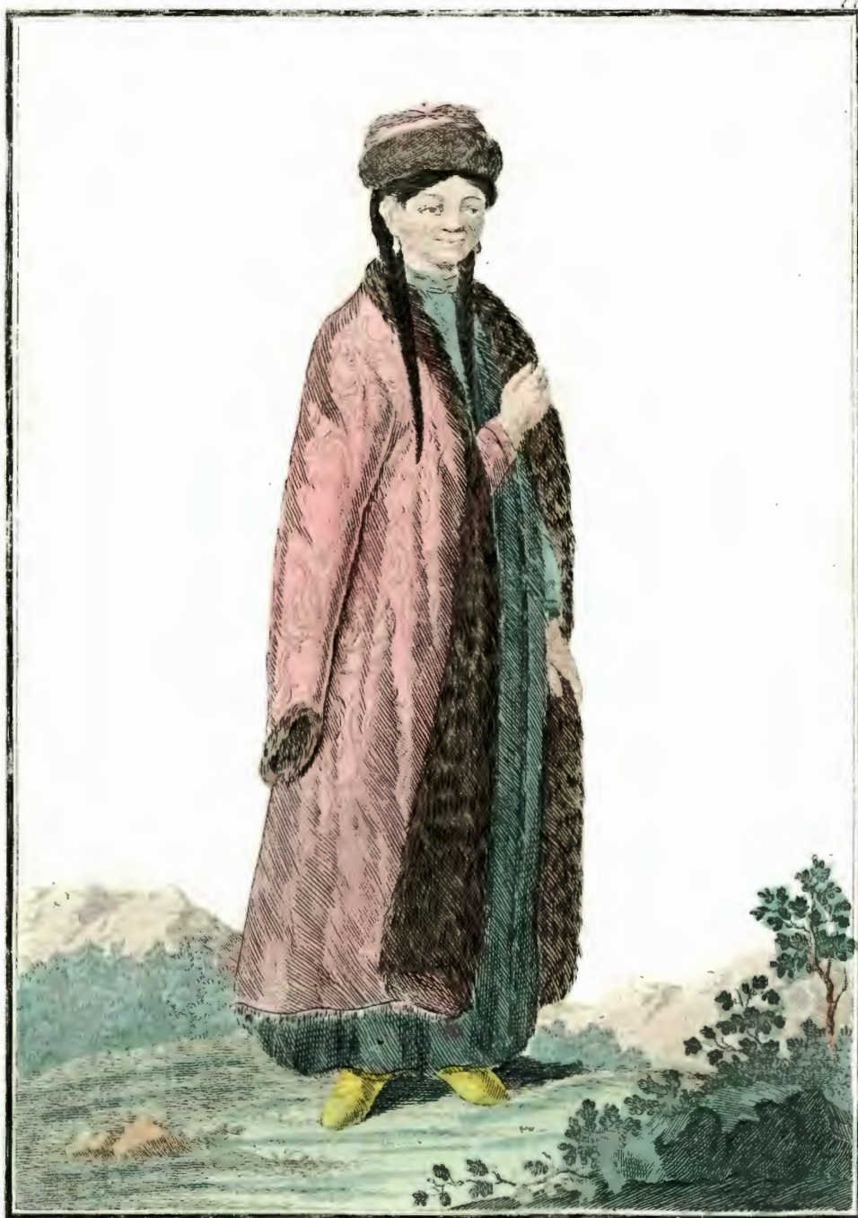
калмычка. Eine Kalmückin. Une Femme Kalmuque.