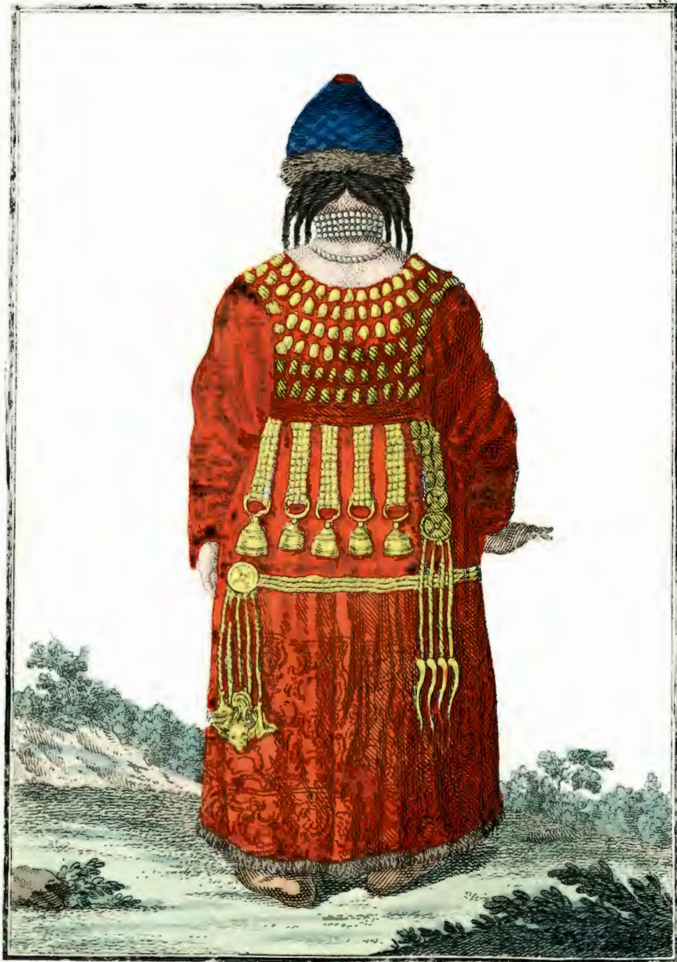
Брацкая Дѣвушка въ Удинскомъ Острогѣ сзади. Eine Bratzkische Jungfer zu Udinskoi Ostrog rückwarts Fille bratzke a Udinskoi Ostrog par derriere.