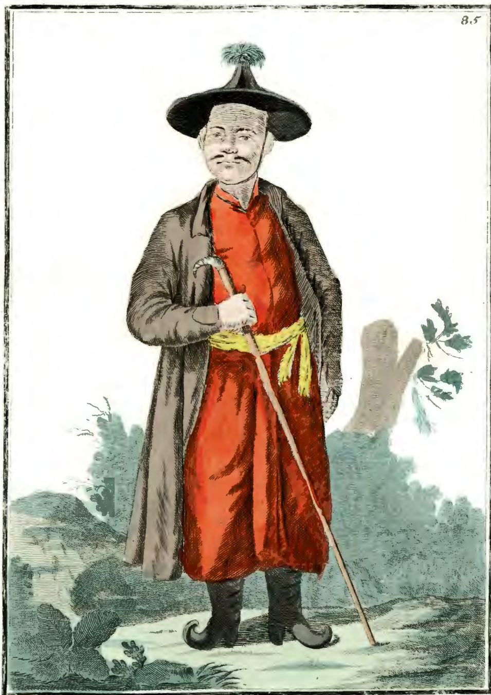
Монгольскій Лама или Духовный. Ein Mongolischer Lama od: Geistlicher. Lama, ou Prêtre Mongol.