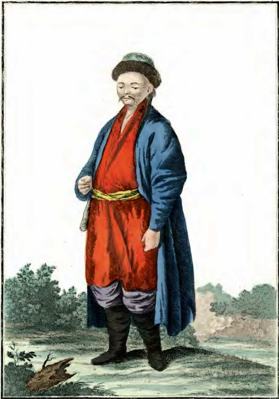
Kalmuck. Ein Kalmuck. Un Kalmuque.