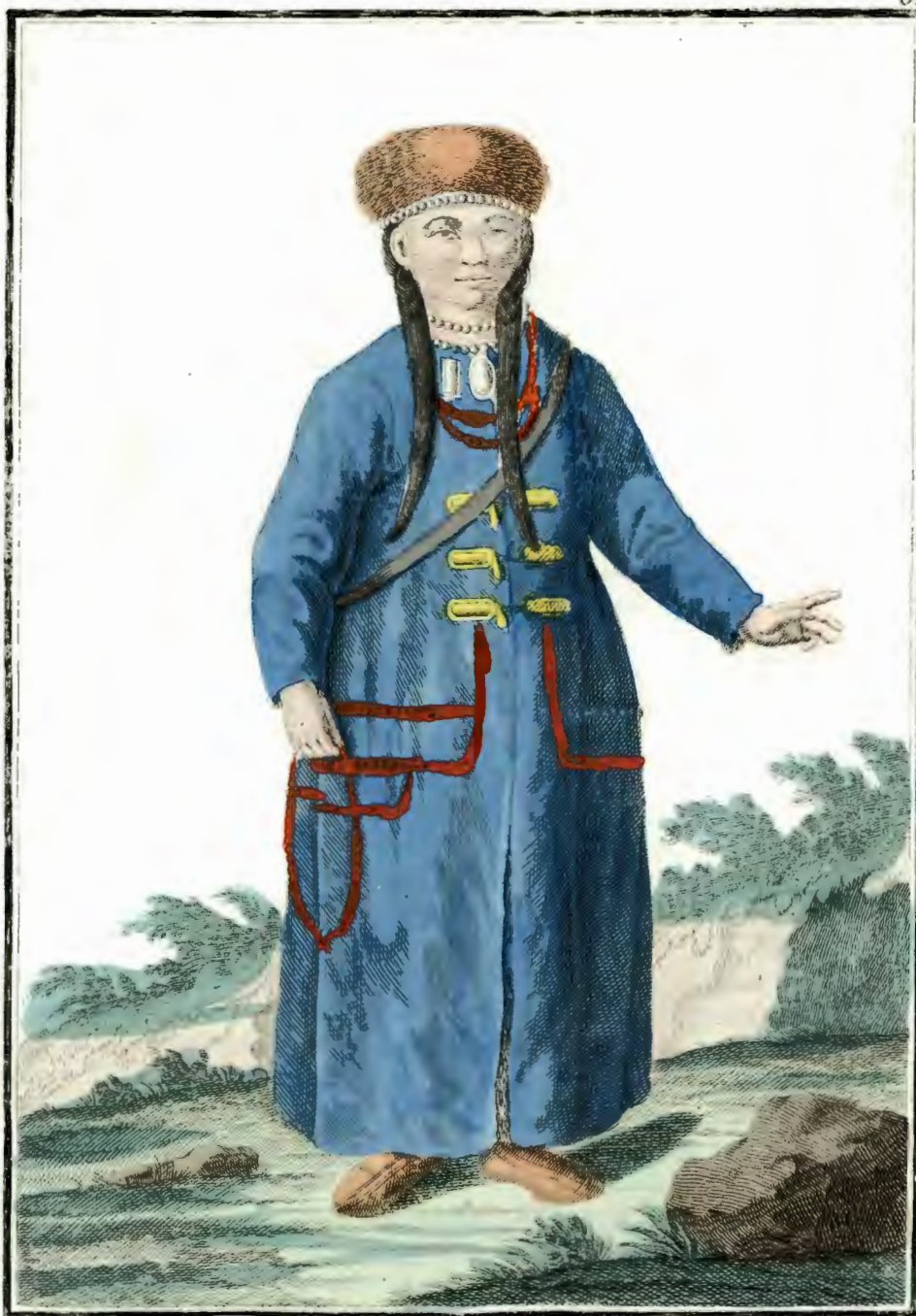
2 Montzalka. Eine Mongolische Frau. Femme Mongole.