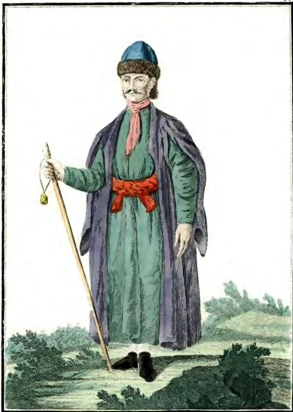
Армениецъ. Ein Armenianer. Un Arménien.