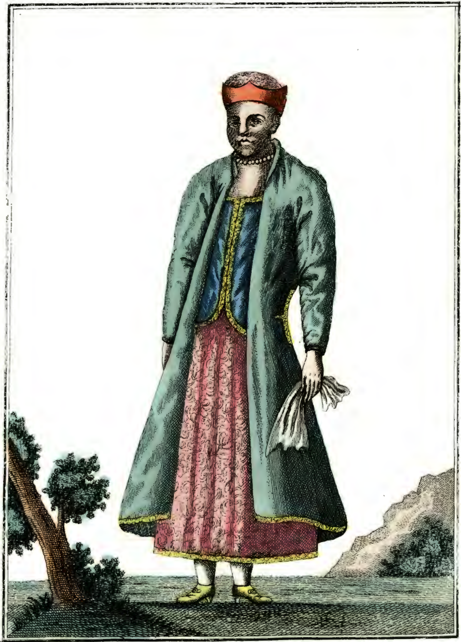
Полка. Ein Polnische Weib. Une Polonoise.