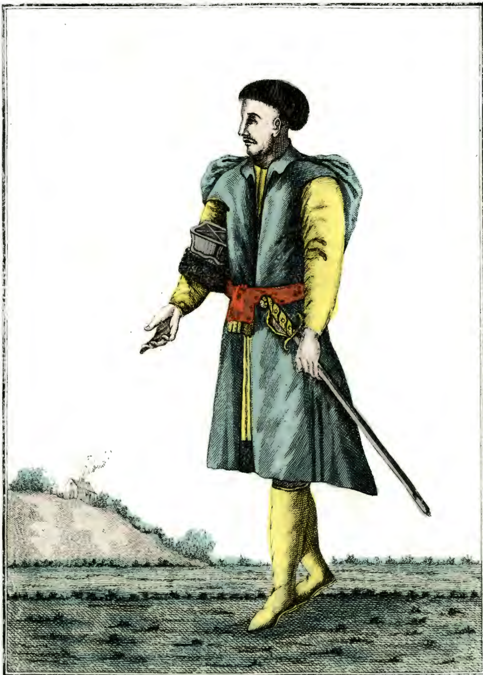
Полякъ. Ein Polack. Un Polonois.