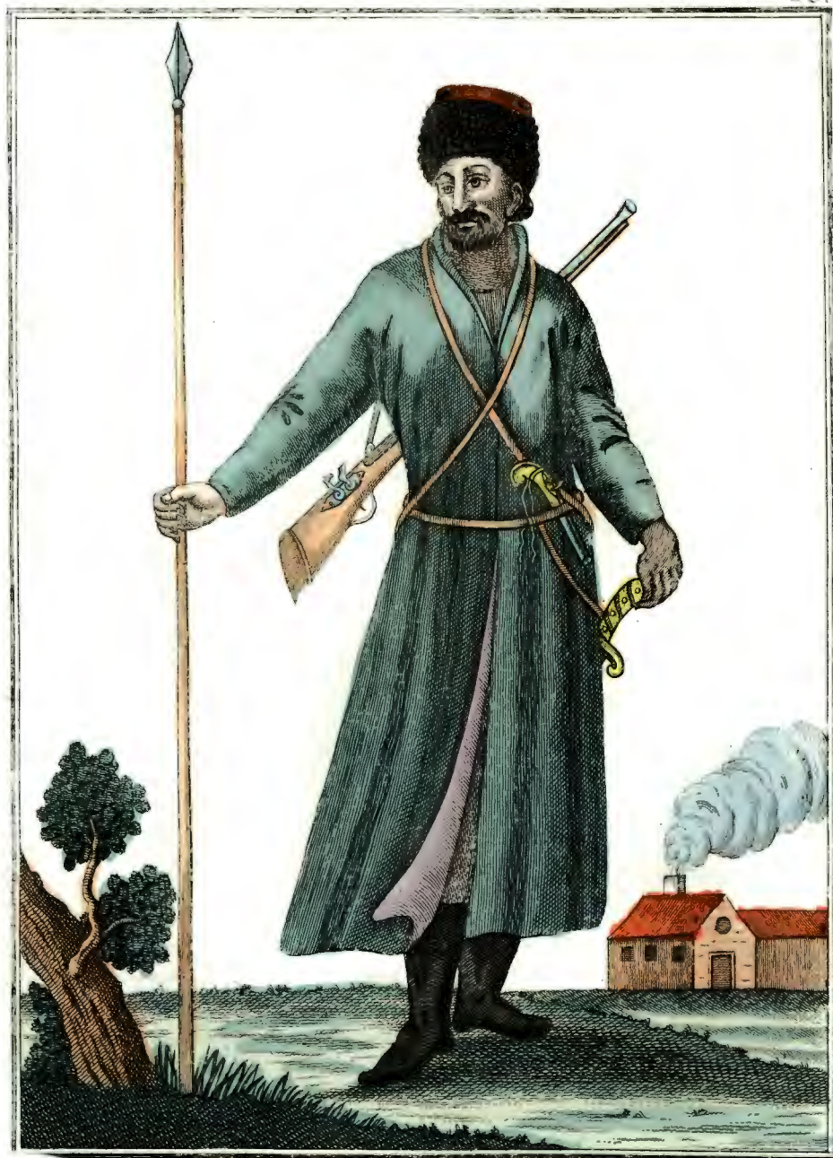
Донскій. Козакъ. Ein Donische Cosacy. Un Cosaque Donois.