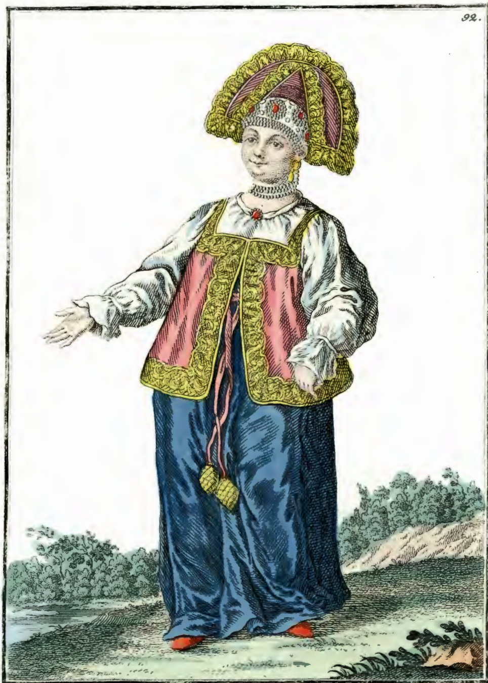
Калужская купеческая жена въ лѣтнемъ платьѣ . Eine Kaufmanns-Frau aus Kaluga im Sommer-Kleide. Femme d'un marchand de Kaluga en habit d'été.